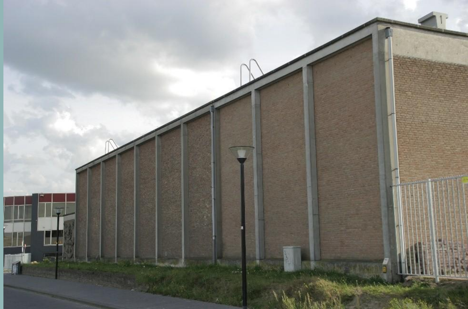
Kunstenaar Jan Ros, 'Pool', 2005 Eneco trafo Station Amersfoort

'Een kunstwerk dat even een kleine error veroorzaakt en dan maakt dat je de potentie van een dak weer even scherp hebt.'